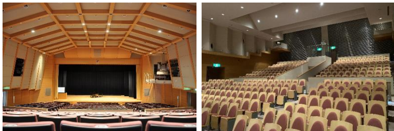
【左写真】桜の聖母短期大学のマリアンホール講堂

福島学院大学、桜の聖母短期大学、福島学院大学短期大学部の3機関で、互いの施設を共同利用するべく「福島市産官学連携プラットフォームにおける施設利用に関する覚書」を10月1日付けで締結し、それに基づいて10月23日に合同SD・FD研修を、その振り返りを10月28日に、福島学院大学の企画・運営、桜の聖母短期大学と福島学院大学の会場提供により実施しました。