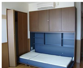
収納家具・収納ベッド