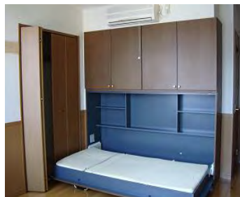
収納家具・収納ベッド