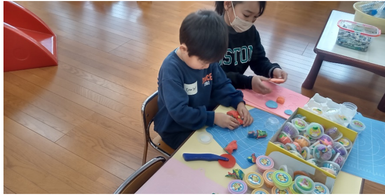
結構人気です・・のびーる粘土です。