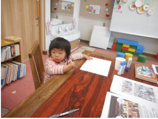
何を描くのかな？Nちゃん