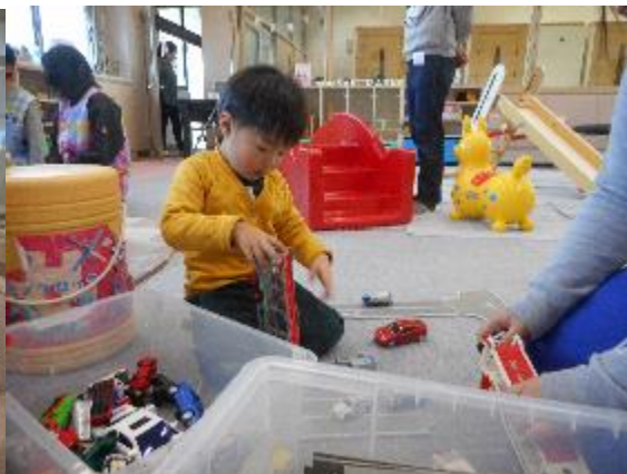
親子入り乱れて・・・誰が誰の子どもだかわかりません・・・いつものことです