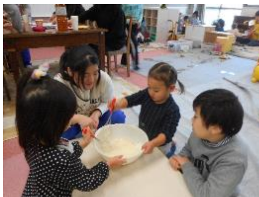
SちゃんHちゃんを見守るYくん