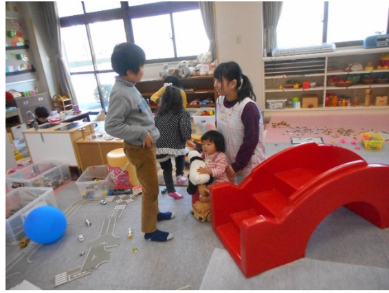
Yくんが小さいお友達を気にかけてくれます