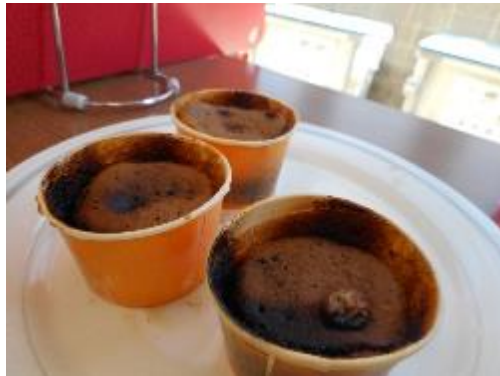
途中事故があって、焦げました・・・