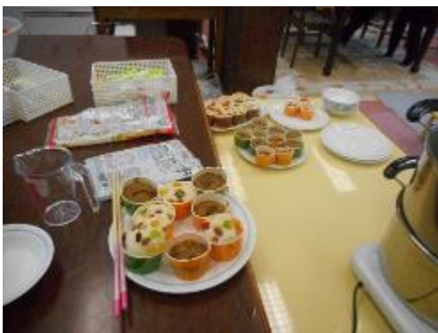
今日のおやつ完成バージョン

別の学生たちは、毛糸を見つけて、指編みを始めました。「わあ懐かしい！」声が弾みます。本当の遊びの世代間の伝達って、こういうことなのではないかな・・・と感心する私です。指編みは、とっくに忘れてしまって、眺めるだけのおばちゃんでした。