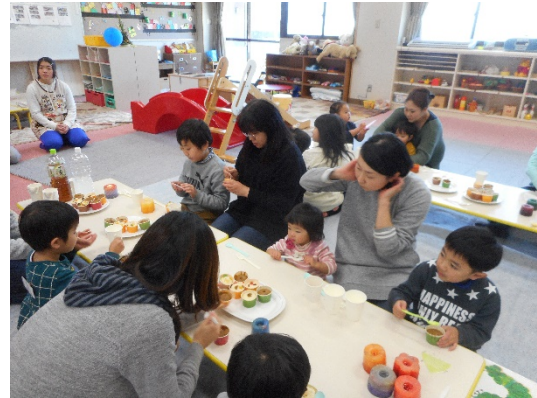
Tくんは沖縄の黒糖蒸しケーキが気に入ってくれました！よかったです