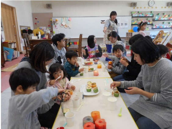
Rちゃんは、スプーンで自分で食べています