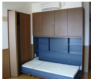
収納家具・収納ベッド