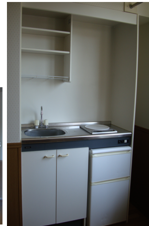
IHクッキングヒーター・冷凍、冷蔵庫