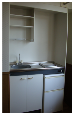
IHクッキングヒーター・冷凍、冷蔵庫