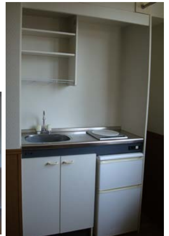
IHクッキングヒーター・冷凍、冷蔵庫