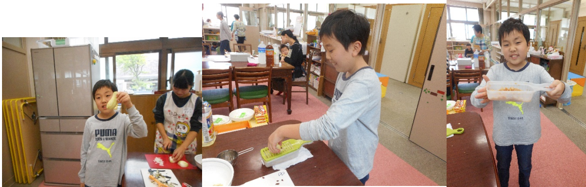
Yくんは、ナスの皮をむいたり、リンゴを下ろしたり、「甘口カレー」にするためのお手伝い

野菜を切ったり、いためたり、さくらっこたちも熱心に参加してくれました。何があっても、最後は「おいしい!」「おいしい!」と、2鍋すっかり食べきって、大満足でした。さくらっこも、お父さんお母さんたちも、学生たちも、今日は高校生たちまで、「広場」の力には、いつもながら脱帽です。