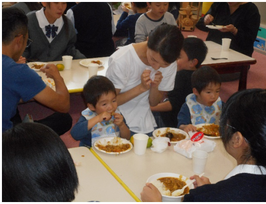
パパからママにバトンタッチして・・・