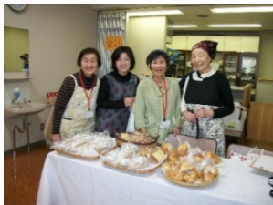
パンとシホンケーキコーナー