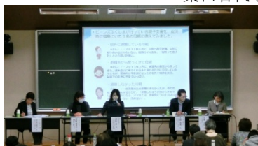
シンポジストの発表