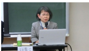
シンポジストのみなさん⇒