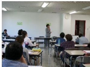
傾聴ボランティアゼミナー

➤ これと並行して会津若松社会福祉協議会主催の「傾聴養成講座 “ゼミナー”」では、「傾聴ボランティアさくら」から数名ずつ派遣されアシスタントをさせていただきました。